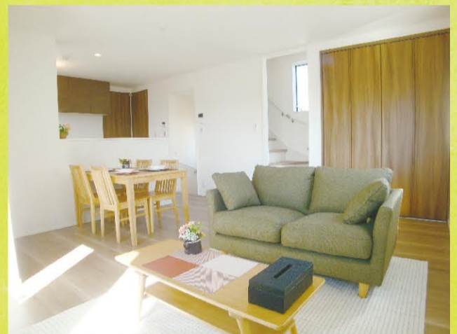
※販売価格に家具は含まれておりません。

写真やWEBサイトでは体感できない 陽当り・開放感 富士山を望むロケーション を是非現地にて体感して下さい